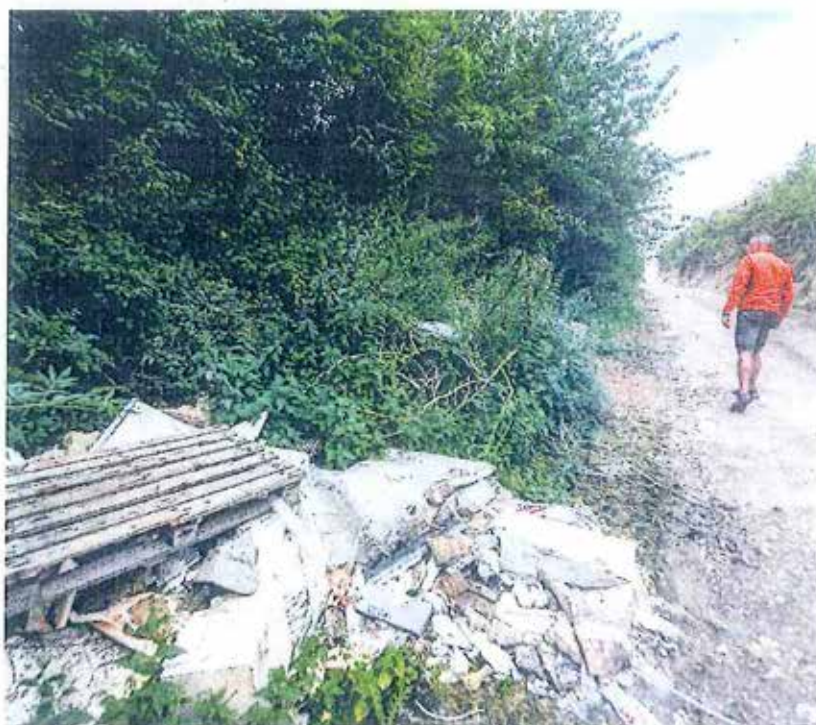
Dépôt sauvage à Feuchy près de la déchetterie de Saint-Laurent-Blangy.

chemin dit des 14, entre Viny et Avion. Là encore, des débris de toutes sortes, provenant souvent de chantiers de bâtiment. Une caméra a même été installée sur place pour dissuader les indélébiles. Certains mettent également en cause les déchetteries de l'Arrageois, accusées de ne pas reprendre les plaques en fibrociment contenant de l'amiante et de faire payer trop cher les petites entreprises, quand elles ne refusent pas carrément les excès de déchets verts ? ■